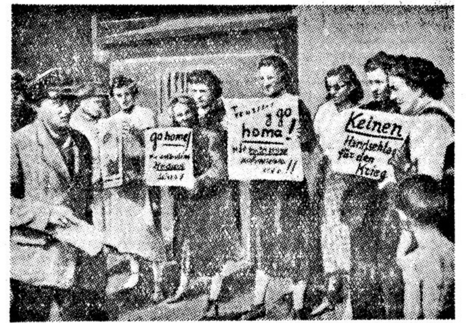
Надписи на плакатах, которые держат эти женщины—сторонники мира, устроившие демонстрацию на одной из улиц Гамбурга (Западная Германия) неподалеку от порта, обращены один к соотечественникам, другие—к иностранцам. «Мы и пальцем не пошевельнем для войны!»—этот призыв предназначен для гамбургских dockers. Надпись, сделанная на английском языке: «Убраться домой»—адресована солдатам английских оккупационных войск.

В городе Дряново, на окрестной конференции сторонников мира, за один час было собрано 452 тысячи левов в международный фонд мира.