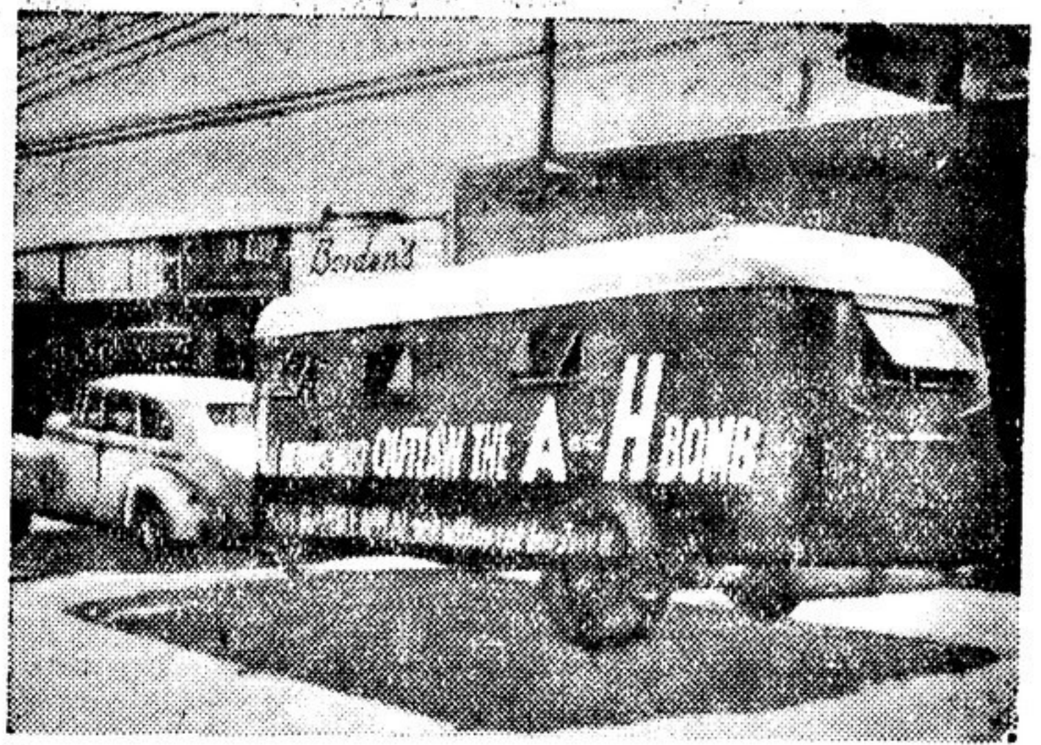
Отделение прогрессивной партии США в Сан-Франциско использует этот автомобильный прицеп в нападении сбора подписей под Стокгольмским Воззванием. Он побывал во многих городах и сельских местностях штата Калифорния. Надпись на автобусе призывает «поставить атомную и водородную бомбы вне закона».

К началу Второго Всемирного конгресса сторонников мира в Восточном Китае поведены итоги по сбору подписей под Стокгольмским Воззванием. Как сообщает газета «Цзефанжибао», в настоящее время 60 миллионов человек, или 44,5 процента всего населения Восточного Китая, поставили свои подписи под Воззванием.